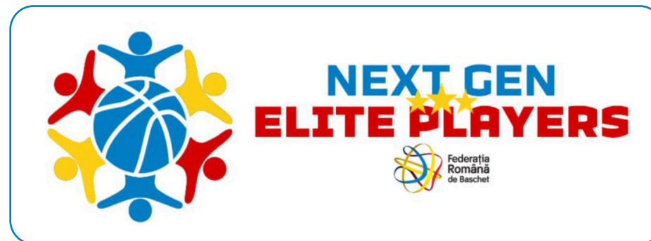
LOGO PROIECTE - COMPUS SIMBOL + DENUMIRE PROIECT