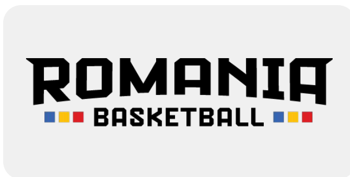
LOGO ROMANIA BASKETBALL ORIZONTAL - POZITIV