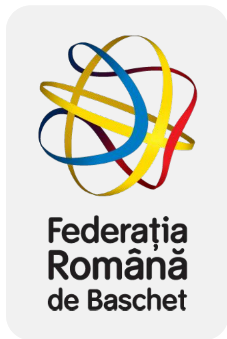
LOGO FRB VERTICAL FULL-COLOR - POZITIV

Aplicarea se realizează exclusiv conform variantelor prezentate alături.