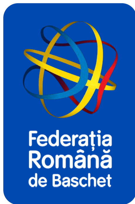
LOGO FRB VERTICAL FULL-COLOR - NEGATIV