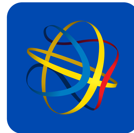
SIMBOL FRB - FULL-COLOR FUNDAL NEGATIV