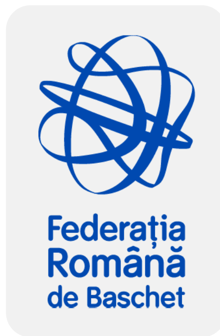
LOGO FRB VERTICAL MONOCROM - POZITIV