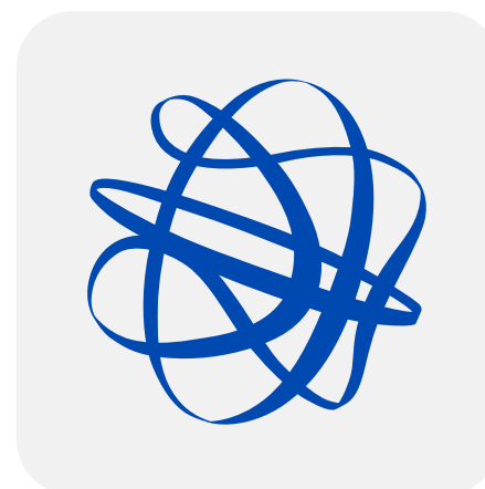
SIMBOL FRB - MONOCROM FUNDAL POZITIV